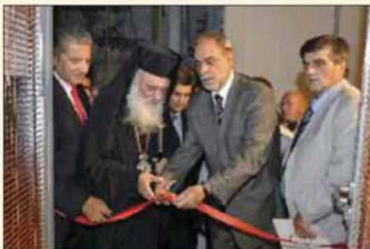
Από τα εγκαίνια του Ιατρείου Κοινωνικής Αλληλεγγύης