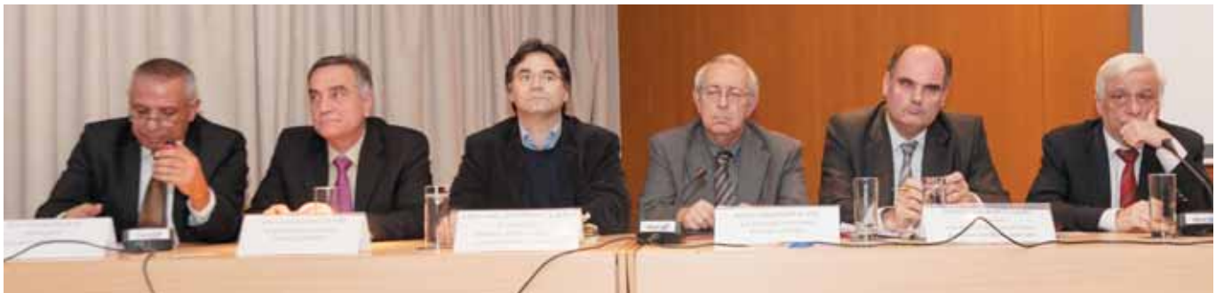
Οι πανεπιστημιακοί καθηγητές εισηγητές της Ημερίδας και ο συντονιστής πρόεδρος της Ένωσης Δημάρχων Αττικής κ. Παύλος Καμάρας.

ντάγματα με αναλυτικές περιγραφές, παραμένουν υπερσυγκεντρωτικά και με ελλιπή λειτουργία των θεσμών.