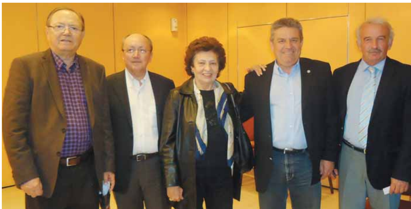
Διατελούντες και διατελέσαντες Δήμαρχοι στο πλαίσιο της Ημερίδας.

στ. Ο κάθε Δήμος της Ελλάδας έχει την ιδιαίτερη ταυτότητά του και μ αυτή θα πρέπει να σχεδιάζεται η οργάνωση, η λειτουργία του, η στελέχωση, ο εξοπλισμός και η οικονομία του.