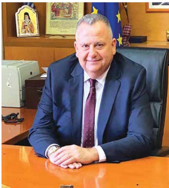
Γιάννης Τομπούλογλου Δήμαρχος Νέας Φιλαδέλφειας- Νέας Χαλκηδόνας

Η πρώτη μας χρονιά ως Δημοτική Αρχή εξελίχθηκε μέσα σε μεγάλες δυσκολίες, για πολλούς λόγους: Πρώτον διότι δεν είχαμε Προϋπολογισμό, καθώς δεν τον κατέθεσε η απελευθερωμένη δημοτική Αρχή ως είχε υποχρέωση. Δεύτερον η οικονομική κατάσταση του Δήμου ήταν τραγική, όπως αποδεικνύεται και από το πόρισμα του Υπουργείου Οικονομικών μετά τον έλεγχο που διενήργησε στον Δήμο μας κατά την περίοδο 2022- 2023. Τρίτον, η τοπική κοινωνία είχε ανάγκη από ένα «σοκ επανεκκίνησης» μετά από πολλά χρόνια στασιμότητας και παρακμής. Όλα αυτά, και άλλα ζητήματα που αντιμετωπίσαμε στην καθημερινότητα των πρώτων μηνών της θητείας μας, μας οδήγησαν τόσο από επιλογή όσο και από ανάγκη στην αναζήτηση καλών πρακτικών που θα μας επέτρεπαν να ξαναδώσουμε αισιοδοξία και προοπτική στους δημότες μας, με δεδομένη την πολύ δύσκολη κατάσταση που σε γενικές γραμμές περιέγραψα.