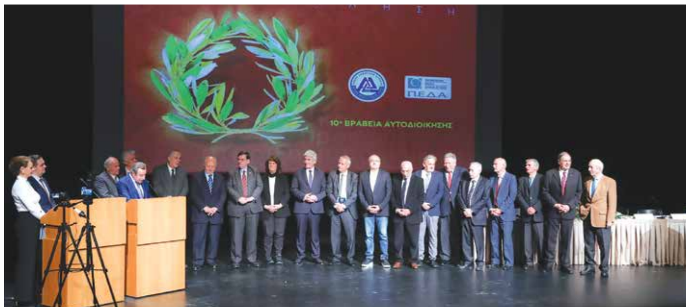
4 Ο Δήμαρχος της Αττικής

Τα Βραβεία της Αυτοδιοίκησης, ένας «θεσμός» πλέον της Τ. Α., που με επιτυχία συνδιοργανώνουν η Ένωση Δημάρχων Αττικής με την Π.Ε.Δ.Α., μπαίνουν στην δεύτερη δεκαετία από την καθιέρωση τους. Μια εκδήλωση, φόρος τιμής προς συνανθρώπους μας και