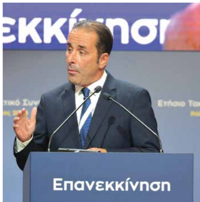
Γιώργος Μαρκόπουλος, Πρόεδρος Π.Ε.Δ.Α – Δήμαρχος Γαλατσίου

Η κυβέρνηση βοηθά την Τοπική Αυτοδιοίκηση μέσω αυτών των εργαλείων να υλοποιήσει συγκεκριμένα έργα. Αλλά και η Τοπική Αυτοδιοίκηση βοηθά την κυβέρνηση να δείξει απορροφητικότητα και να φέρει εις πέρας τα προγράμματά της. Και όλοι μαζί, βελτιώνουμε τη ζωή των πολιτών, το οποίο είναι και το ζητούμενο.