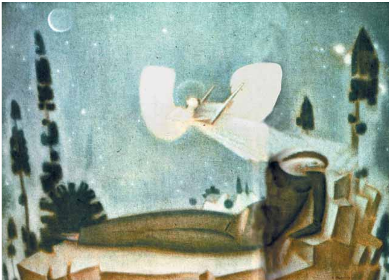
Κωνσταντίνος Παρθένης, Νύχτα , 1917