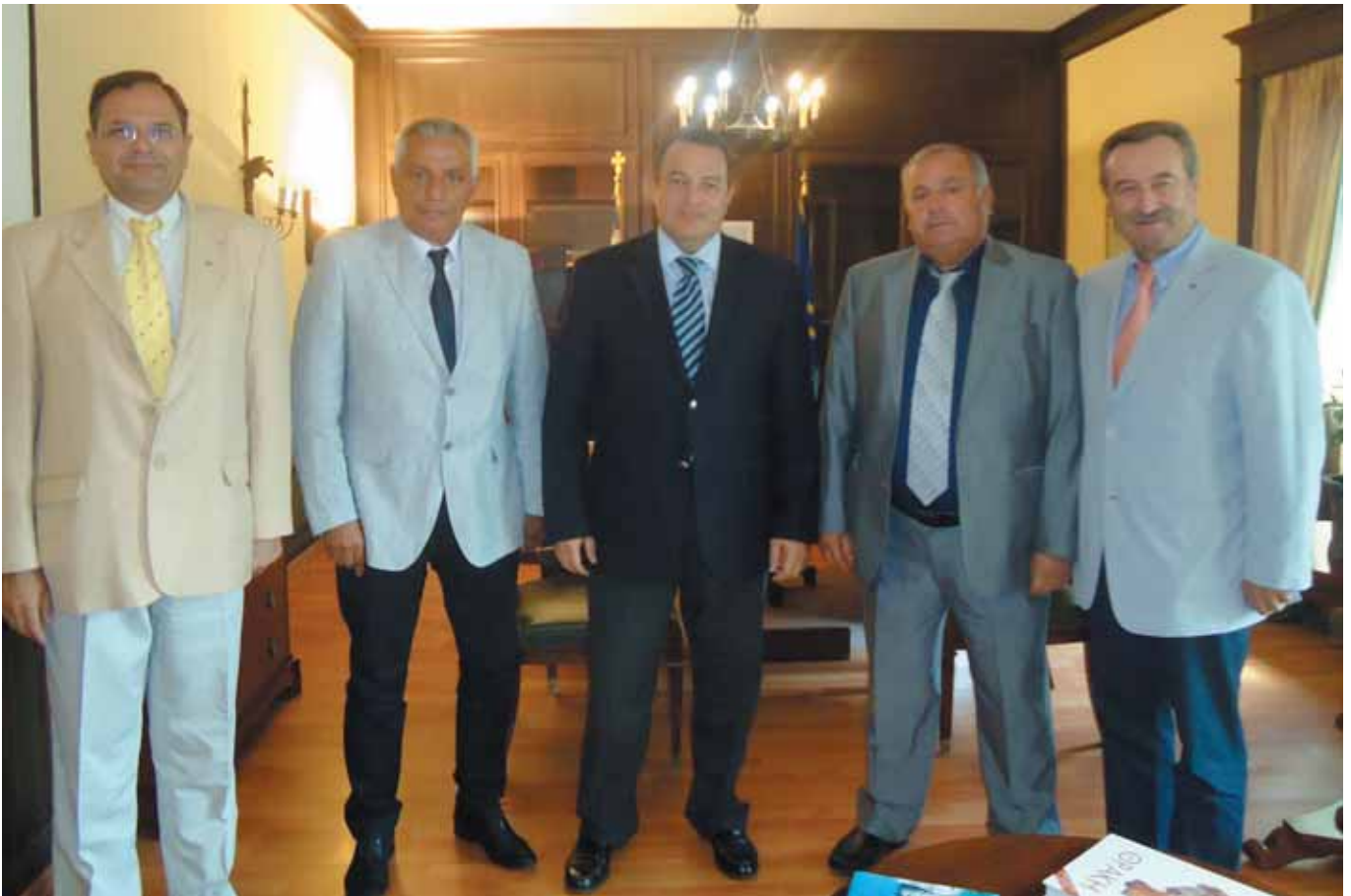
Μέλη του Δ. Σ. της Ένωσης Δημάρχων Αττικής με τον Υπουργό Εσωτερικών κ. Ευριπίδη Στυλιανίδη.

Τέλος εκφράζουμε την ελπίδα, ότι στις επερχόμενες θεσμικές πρωτοβουλίες του Υπουργού, θα θεσμοθετηθούν και άλλα μέτρα, που θα στοχεύουν στην προσέλκυση ικανών και άξιων πολιτών της κοινωνίας μας στα Κοινά της Αυτοδιοίκησης αλλά και στην ισχυροποίηση του θεσμού στο νέο κοινωνικοοικονομικό περιβάλλον».