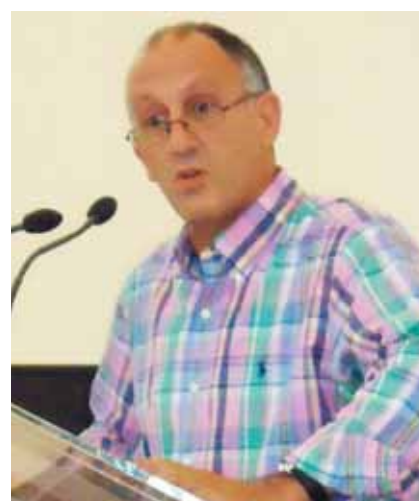
Ο Αντιπεριφερειάρχης Νήσων Αττικής κ. Δημήτρης Κατσικάρης απευθύνει χαιρετισμό.