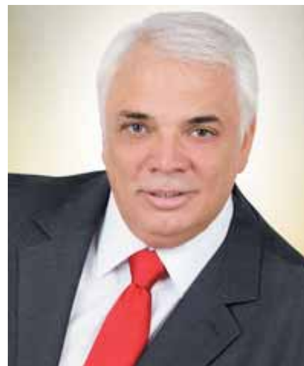
Ο νέος πρόεδρος της ΠΕΔΑ, Νικόλαος Σαράντης, Δήμαρχος Αγίων Αναργύρων - Καματερού

Στη συνεδρίαση, που πραγματοποιήθηκε μετά από πρόσκληση του δημάρχου Αγίων Αναργύρων - Καματερού κ. Νικολάου Σαράντη, που πλειοψήφησε στις αρχαιρεσίες της 23/9, ήταν παρόντες και οι 25 εκλεγέντες Σύμβουλοι. Τη θέση του δημάρχου Ζωγράφου κ. Κωνσταντίνου Καλλίρη, που παραιτήθηκε λόγω της εκλογής του στο Δ.Σ. της ΚΕΔΕ, πήρε, ως πρώτος αναπληρωματικός ο δήμαρχος Παλλήνης κ. Αθανάσιος Ζούτος.