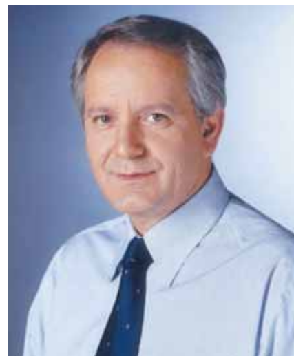
Ο νέος πρόεδρος της ΚΕΔΕ Κώστας Ασκούνης, Δήμαρχος Καλλιθέας

Σ τη συνεδρίασή του της 13ης Οκτωβρίου 2011 το Διοικητικό Συμβούλιο της Κεντρικής Ένωσης Δήμων Ελλάδος και εξέλεξε το Προεδρείο και την Εκτελεστική Επιτροπή και το Εποπτικό της Συμβούλιο.