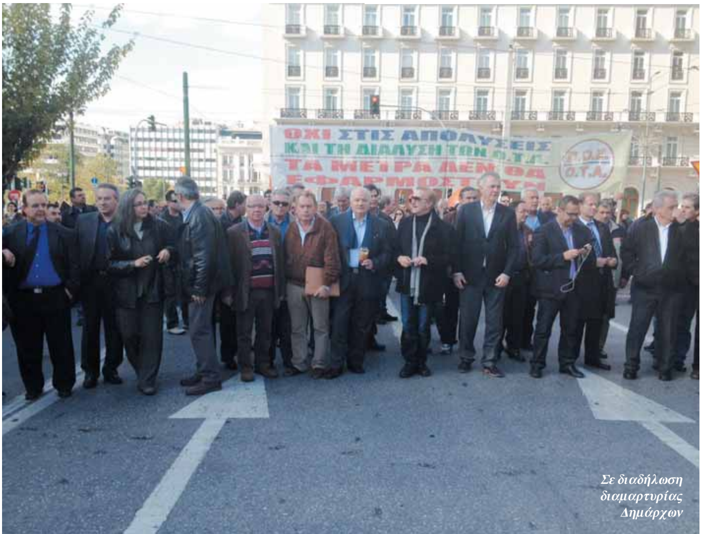
Σε διαδήλωση διαμαρτυρίας Δημάρχων