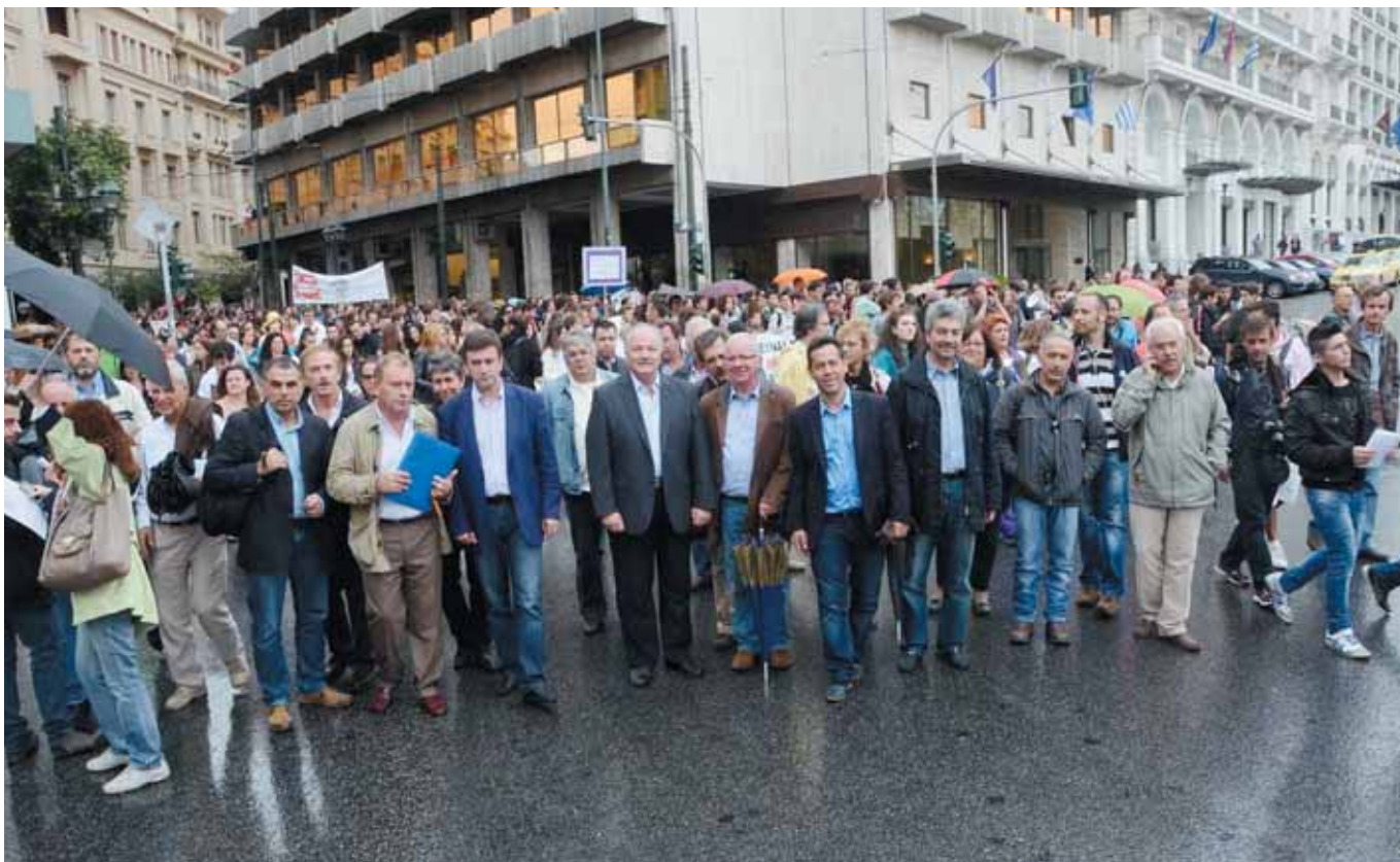
Συγκέντρωση διαμαρτυρίας των Δημάρχων.

Ακολουθούν: Το άρθρο για την συγκρότηση και λειτουργία του Παρατηρητηρίου Οικονομικής Αυτοτέλειας των ΟΤΑ, (στο οποίο θα αναφερθούμε στη συνέχεια), καθώς και εκτεταμένες παράγραφοι με μέτρα που αναφέρονται στις μετα-