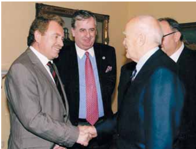
Σε συνάντηση με τον Πρόεδρο της Δημοκρατίας κ. Κάρολο Παπούλια.

«Αμφικτιονία» και αντιπρόσωπος της χώρας μας στο Διεθνές Δίκτυο Πόλεων της Μεσογείου COPPEM.