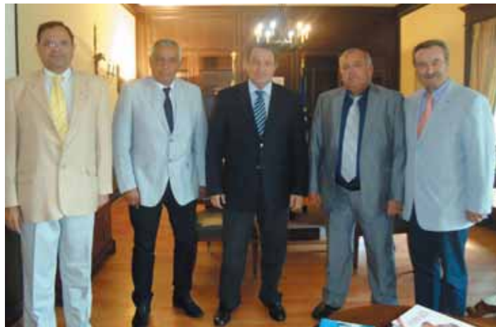
Το Δ.Σ. της Ένωσης Δημάρχων Αττικής με τον Υπουργό Εσωτερικών κ. Ευρυπίδη Στυλιανίδη.

Το ΥΠΟΜΝΗΜΑ αυτό παραδόθηκε επίσης στον Υπουργό Οικονομικών κ. Γιάννη Στουρνάρα και στον πρόεδρο της Βουλής κ. Ευάγγελο Μεϊμαράκη.