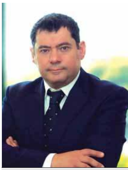
Τάσος Μαυρίδης Δήμαρχος Λυκόβρυσης – Πεύκης

Ο Δήμος Λυκόβρυσης – Πεύκης συνεχίζει μια μακρά παράδοση δεκαετιών στην αλληλεγγύη και στις παρεχόμενες κοινωνικές υπηρεσίες προς τον πολίτη, τις οποίες προσπαθούμε να εμπλουτίσουμε.