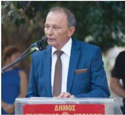
Σπυρίδων Πολλάλης – Δήμαρχος Τροιζηνίας