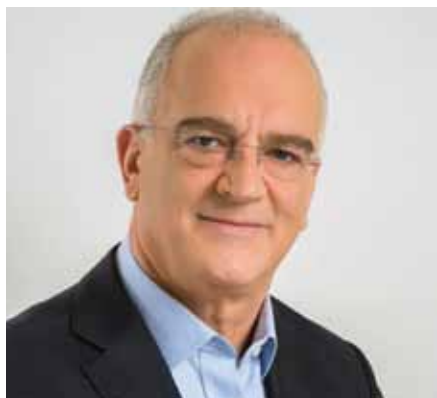
Αθανάσιος Ζούτσος – Δήμαρχος Παλλίνης