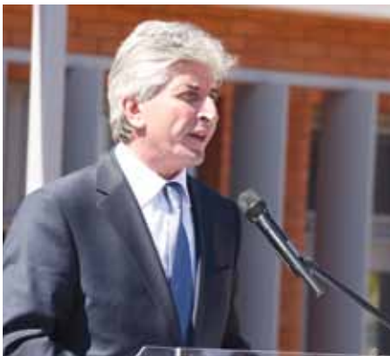
Δημήτριος Κιούσης – Δήμαρχος Κρωπίας