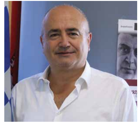
Νικόλαος Μπάμπαλος – Δήμαρχος Ηρακλείου