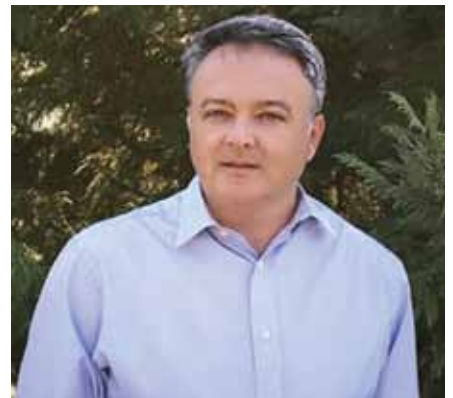
Γεώργιος Πασσημάκης – Δήμαρχος Ωρωπού