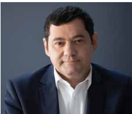
Αναστάσιος Μαυρίδης – Δήμαρχος Λυκόβρυσης – Πεύκης