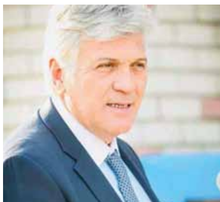
Χρήστος Στάθης – Δήμαρχος Μάνδρας – Ειδυλλίας