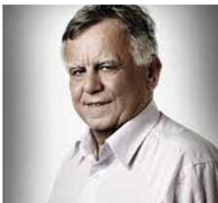
Ιωάννης Αθανασίου – Δήμαρχος Αγκιστριού