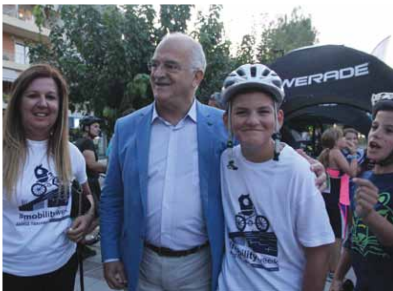
Ποδηλασία για καλό σκοπό! Ο Δήμαρχος Παλλήνης Αθανάσιος Ζούτσος με συμμετέχοντες στη διοργάνωση!

Η αλλαγή του τρόπου με τον οποίο μετακινούμαστε, αποτελεί βασική προτεραιότητα του Δήμου Παλλήνης, καθώς αντιλαμβανόμαστε ότι τόσο υπό την απειλή της κλιματικής αλλαγής, όσο και η συνείδηση των αρνητικών συνεπειών και άλλων επιπτώσεων του αυτοκινήτου, το ζητούμενο για τις πόλεις του αύριο είναι η δημιουργία ενός νέου μοντέλου βιώσιμης κινητικότητας.