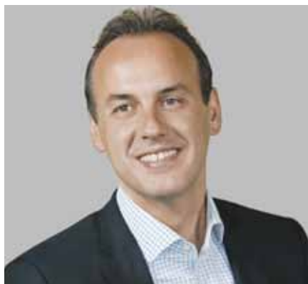
Γεώργιος Παπανικολάου – Δήμαρχος Γλυφάδας