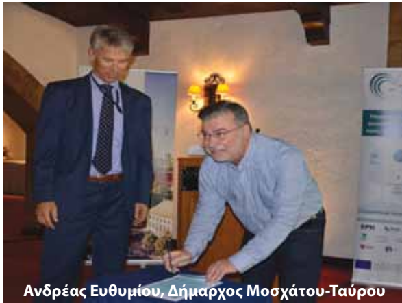
Ανδρέας Ευθυμίου, Δήμαρχος Μοσχάτου-Ταύρου