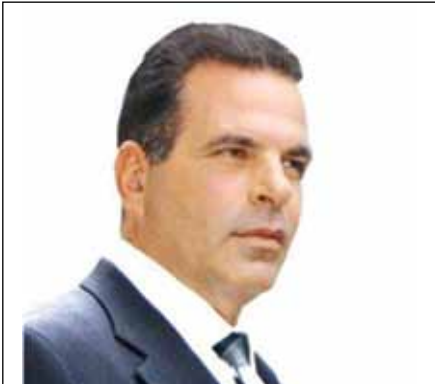
Παναγιώτης Λυράκης – Δήμαρχος Σπετσών