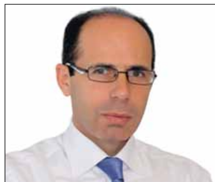
Ευάγγελος Μπουρνούς – Δήμαρχος Ραφίνας – Πικερμίου