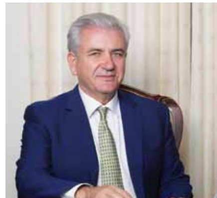
Δημήτριος Λουκάς – Δήμαρχος Λαυρεωτικής