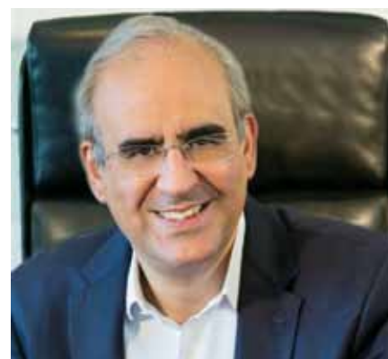
Γεώργιος Θωμάκος – Δήμαρχος Κηφισιάς