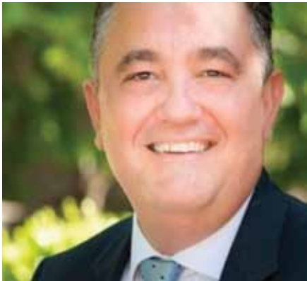
Βασίλειος Θώδας – Δήμαρχος Ζωγράφου