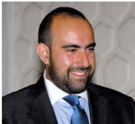
Ευστράτιος Χαρχαλάκης – Δήμαρχος Κυθήρων