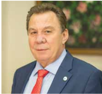
Νικόλαος Μελετίου – Δήμαρχος Ασπροπύργου