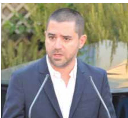
Ιωάννης Δημητριάδης – Δήμαρχος Πόρου