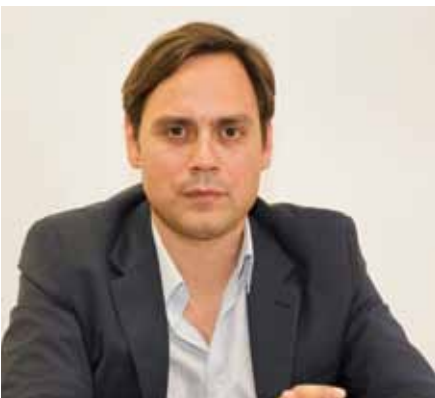
Ευάγγελος Ντηνιακός – Δήμαρχος Χαϊδαρίου