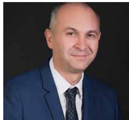
Ευστράτιος Σαραούδας – Δήμαρχος Μεταμόρφωσης