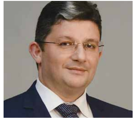
Σπυρίδων Βρεττός – Δήμαρχος Αχαρών