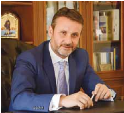
Γεώργιος Παναγόπουλος – Δήμαρχος Σαλαμίνα