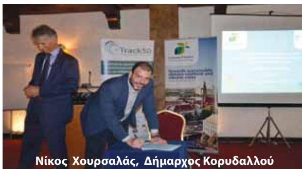
Νίκος Χουρσαλάς, Δήμαρχος Κορυδαλλού