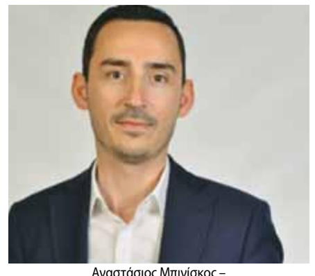
Αναστάσιος Μπινίσκος – Δήμαρχος Δάφνης – Υμηττού