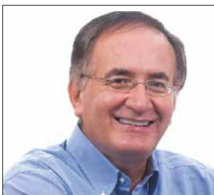
Στέφανος – Γαβριήλ Βλάχος – Δήμαρχος Πετρούπολης