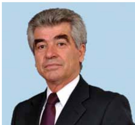
Γρηγόριος Σταμούλης – Δήμαρχος Μεγαρείων