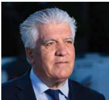
Βασίλειος Ζορμπάς – Δήμαρχος Αγίας Παρασκευής