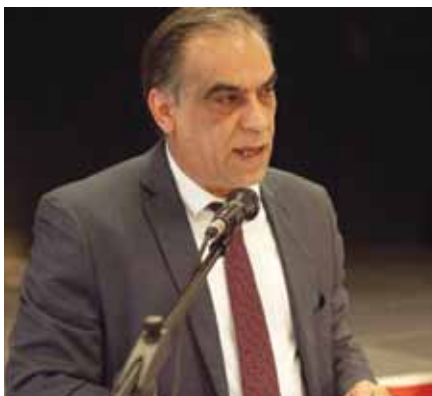
Ιωάννης Λαγουδάκης – Δήμαρχος Περάματος