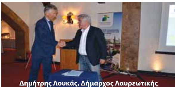
Δημήτρης Λουκάς, Δήμαρχος Λαυρεωτικής