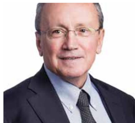
Στέργιος Τσίρκας – Δήμαρχος Μαραθώνος