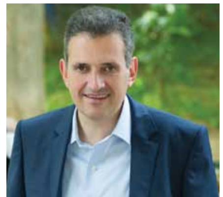
Δημήτριος Καρναβός – Δήμαρχος Καλλιθέας