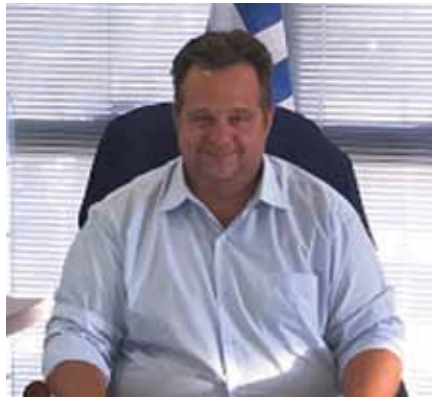
Γεώργιος Χατζηδάκης – Δήμαρχος Ηλιούπολης