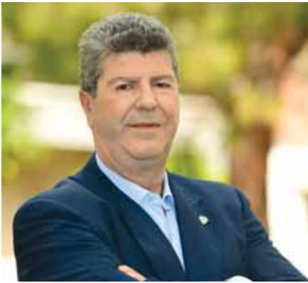
Ιωάννης Γκίκας – Δήμαρχος Αιγάλεω