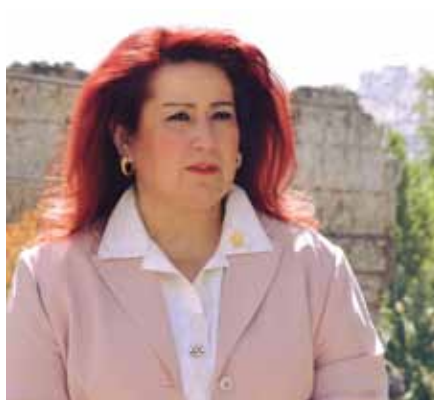
Δέσποινα Θωμαΐδου – Δήμαρχος Νέας Ιωνίας