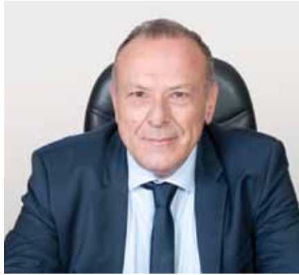
Αργύριος Οικονόμου – Δήμαρχος Ελευσίνας