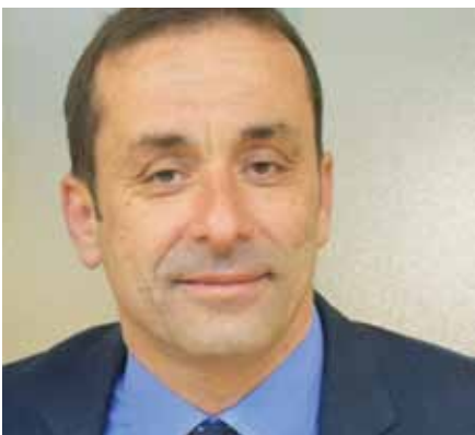
Γεώργιος Μαρκόπουλος – Δήμαρχος Γαλατίου