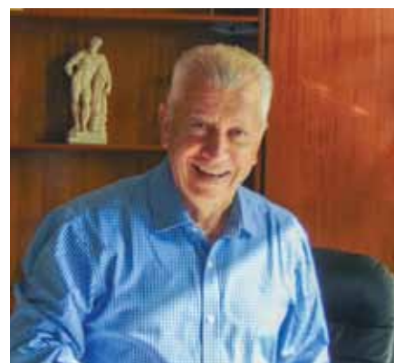
Σταύρος Τζουλάκης – Δήμαρχος Νέας Σμύρνης