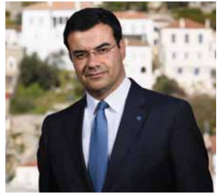
Γεώργιος Κουκουδάκης – Δήμαρχος Ύδρας