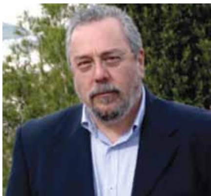
Χρήστος Βοσκόπουλος – Δήμαρχος Καισαριανής