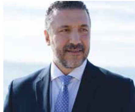
Ιωάννης Φωστηρόπουλος – Δήμαρχος Παλαιού Φαλήρου