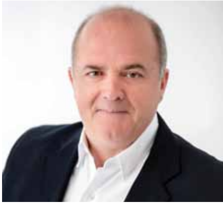
Ιωάννης Καλαφατέλης – Δήμαρχος Διονύσου