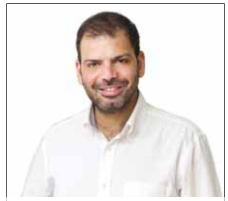
Νικόλαος Χουρσαλάς – Δήμαρχος Κορυδαλλού