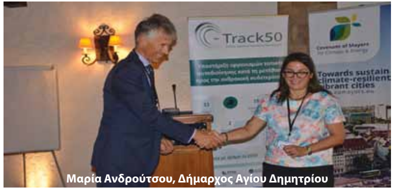
Μαρία Ανδρούτσου, Δήμαρχος Αγίου Δημητρίου