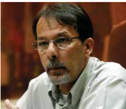
Χρήστος Βρεττάκος – Δήμαρχος Κερατσινίου – Δραπετσώνας