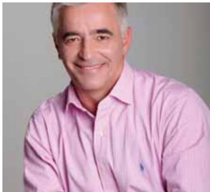
Ισίδωρος Μάδης – Δήμαρχος Παιανίας