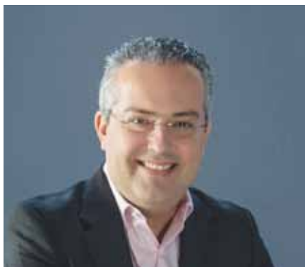
Ηλίας Αποστολόπουλος – Δήμαρχος Παπάγου – Χολαργού