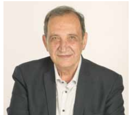
Γρηγόριος Κατωπόδης – Δήμαρχος Βύρωνος