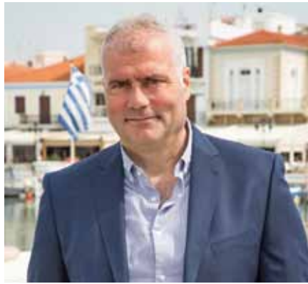
Ιωάννης Ζορμπάς – Δήμαρχος Αιγίνης