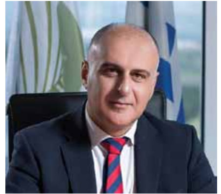
Δημήτριος Μάρκου – Δήμαρχος Σπάτων – Αρτέμιδος