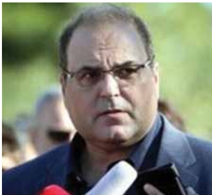
Συμεών Ρούσσος – Δήμαρχος Χαλανδρίου