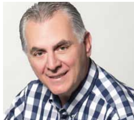
Ανδρέας Παχατουρίδης – Δήμαρχος Περιστερίου