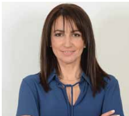
Δήμητρα Κεχαγιά – Δήμαρχος Πεντέλης