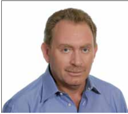
Πέτρος Φιλίππου – Δήμαρχος Σαρωνικού