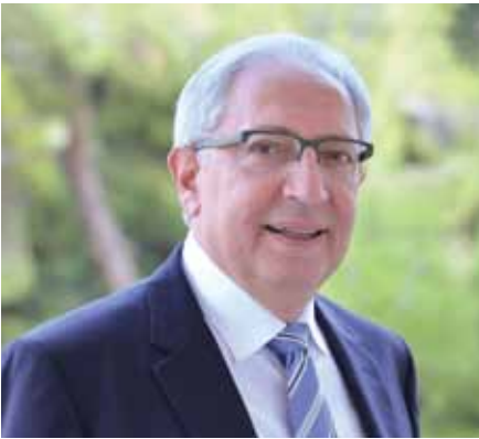
Θεόδωρος Αμπατζόγλου – Δήμαρχος Αμαρουσίου