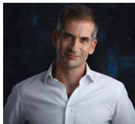
Κωνσταντίνος Μπακογιάννης – Δήμαρχος Αθηναίων